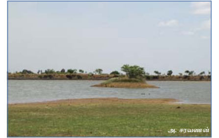
வைராவிகுளத்தின் நடுவே அமைக்கப்பட்டுள்ள தீவு

குளங்களைப் பாதுகாக்க கடந்த பல ஆண்டுகளாக ஏட்ரி ஆராய்ச்சி நிறுவனம் பல முயற்சிகளை மேற்கொண்டு வருகிறது. குளக்கரைகளில் மண் அரிப்பைத் தடுப்பதற்குப் பலவகையான மரக்கன்றுகளை நட்டு தண்ணீர் விட்டு வளர்ப்பதோடு, பொதுப்பணித்துறை மற்றும் பஞ்சாயத்தின் உதவியுடன் குளத்தின் நடுவில் சிறு தீவு அமைத்தும் மரம் நடப்பட்டது. தற்போது அம்மரங்கள் மற்றும் அமைக்கப்பட்டுள்ள தீவும் பறவைகளைக் கவர்ந்திழுக்கின்றன. பறவைகள் அமர்ந்து