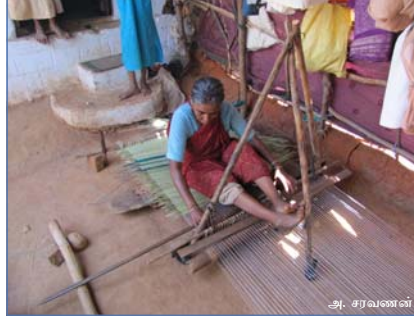
பாய்முடைதலில் ஈடுபட்டுள்ள பெண்மணி

தாமிரபரணியும் அதனைச் சார்ந்த குளங்களும் பல்வேறு வகையில் நீர்வாழ் உயிரினங்களுக்கு மட்டுமின்றி மக்களின் தேவைகளையும் பூர்த்தி செய்து வருகின்றன. குறிப்பிடும்படியாக, முன்பு இப்பகுதியின் நீர்நிலைகளில் கிடைத்த பாய்க் கோரையினால் பாய்முடையும் தொழில் பலருக்கு வாழ்வாதாரமாகத் திகழ்ந்தது. பட்டு போன்ற பாயினை உருவாக்கும் பத்தமடை இப்பகுதியின் கலாச்சார அடையாளமாக இருப்பதற்குக் காரணம் இக்கோரையே ஆகும்.