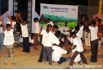
பத்மநேரியில் நேச்சர் டாக்ஸீஸின் அரங்கேற்றம்

குளங்கள் நாட்டின் வளங்கள். விவசாயம் செழிக்க குளங்கள் வேண்டும். குளம் பாசனத்திற்கு மட்டுமல்லாமல், கணக்கிலடங்கா பறவைகள், தாவரங்கள் போன்ற எண்ணற்ற உயிரினங்களுக்கு வாழ்வாதாரமாகவும் மனிதர்களின் பல தேவைகளைப் பூர்த்தி செய்தும் வருகிறது. ஆனால், தற்போது குளங்கள் விளை நிலங்களாகவும், வீட்டு மனைகளாகவும், குப்பைக் கிடங்குகளாகவும் மற்றும் கழிவுநீர்த் தேக்கங்களாகவும் மாறிவருகின்றன.