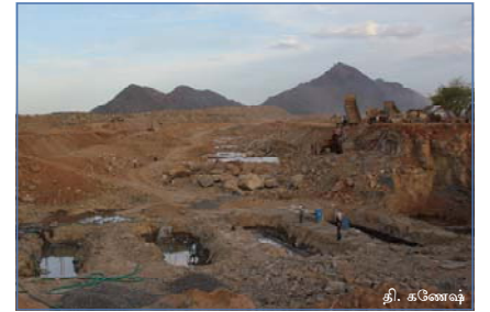
சீர்குலைந்த நிலையில் வீற்றிருந்தான்குளம்

குளத்தின் ஒரு பகுதியை மக்கள் பயன்படுத்துகின்றனர். மறுபகுதியில் மக்கள் நடமாட்டமில்லாததால் பறவைகளும் வாழ்கின்றன. இந்தக் குளம் மக்களும் பறவைகளும் இயைந்து வாழும் குளங்களுக்கு ஒரு எடுத்துக்காட்டாகும்.