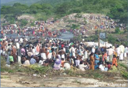
திருவிழாவின்போது திரண்ட மக்களில் ஒரு பகுதி

தாமிரம் கலந்த தண்ணீரைக் கொணரும் தாமிரபரணி எண்ணற்ற மூலிகைகளின் சாரத்தைக் கொண்டு நோய் தீர்க்கும் அறுநீர் கொண்ட வற்றாத ஜீவநதியாக மக்கள் வாழ்வில் பெரும்பங்கு வகிக்கிறது.