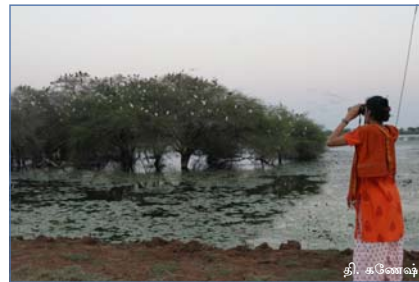
பறவைகளைக் கணக்கெடுக்கும் தன்னார்வர்கள்

'ராம்சர் சைட்ஸ்' என்ற திட்டத்தின் கீழ், நாட்டில் உள்ள பெரியகுளங்களில் மட்டுமே பறவைகளின் கணக்கெடுப்பு