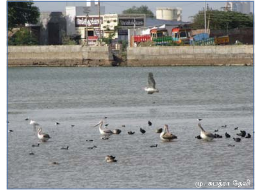
நகரச் சூழலுக்கிடையிலும் நயினார்குளத்தில் காணப்படும் பறவைகள்

இணைக்கும் தொப்புள்கொடியாய்த் திகழும் இந்நீர்நிலைகளின் பாதுகாப்பினை மறப்போமாயின் நமது சந்ததியினர் அல்லலுருவர் என்பது திண்ணம்.